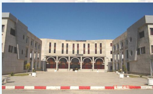
Faculté de Mathématiques.